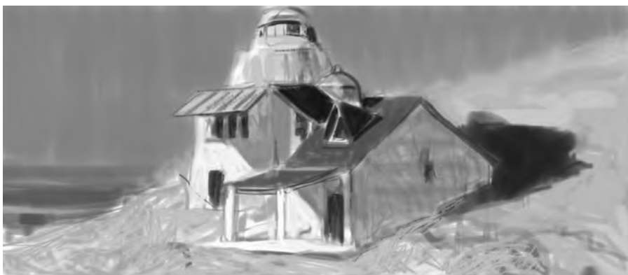
Pintura / Móvil

Tiempos de cambio. Sin duda, vivimos tiempos de cambio: social, político, tecnológico. La mayoría de nosotros, aferrados a un tiempo que ya parece haber cambiado, pero que vamos incorporando poco a poco a nuestras vidas. Escaneo de imágenes, impresiones plotter, comunicación por internet... A todo esto se suma ahora la tecnología de los móviles inteligentes. Es en este último aparato en el que quiero incidir. Un artefacto de dimensiones reducidas, capaz de almacenar más información gráfica que la que seríamos capaces de guardar en varios portafolios. Y que, además, nos ofrece la posibilidad de llevar con nosotros todo un estudio