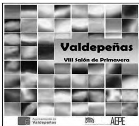
Foto portada catálogo

El acto de inauguración de la exposición tendrá lugar el jueves 15 de mayo, a las 19 horas en el Museo Municipal de Valdepeñas, en una exposición que permanecerá abierta hasta el día 1 de junio y de la que os informaremos puntualmente en el próximo boletín.