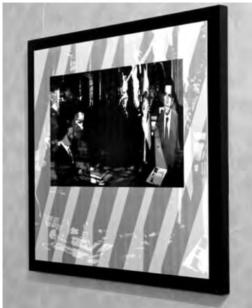
"Presidente en la memoria"

Obra fotográfica de Rosa Gallego del Peso