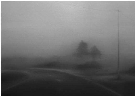
Donación para la AEPE