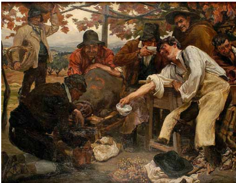
Después de la vendimia, óleo sobre lienzo de Álvaro Alcalá Galiano.

Asimismo, fue galardonado con tercera medalla en el Salón de París de 1910, con segunda en la Universal de Buenos Aires de ese mismo año y con gran premio de honor en la Exposición Internacional de Panamá de 1916.