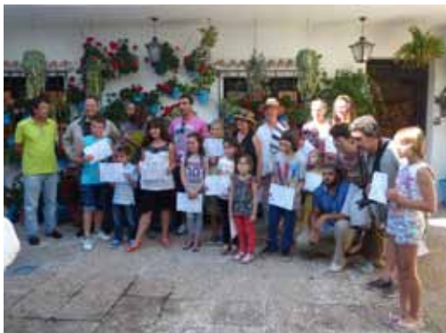
Grupo de niños. Categoría B