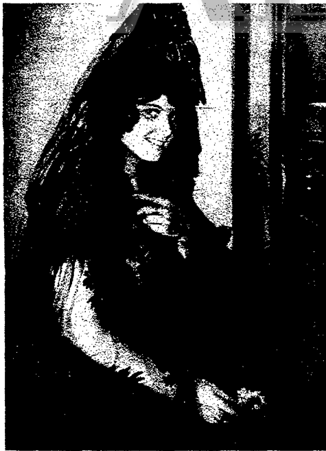
"ALEGRIA DE VIVIR", DE ROGELIO LOPEZ

La falange ofrece, en su desfile, el resalto de personalidades que se insinúan en el orto prometedor de triunfos artísticos y de otras ya consagradas. No quisiera yo omitir menciones dignas de ser traídas a cuento. A trueque de olvidar a quienes no