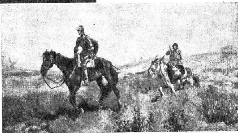
"El caballero de la triste figura", por Moreno Carbonero.