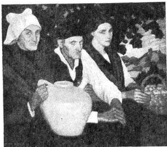
"Abuelos y nieta", por V. Zubiaurre.

L A Asociación de Pintores y Escultores de España ofrece a Buenos Aires su primera exposición, y ello puede y debe considerarse como hecho elevadamente simbólico. Se tiene en cuenta, en efecto, la celebración del IV Centenario de la fundación de nuestra capital; y, por de contado, este fino certamen demuestra que las preocupaciones y actividades de la belleza en la cultura no abandonan a las clases directivas de España ni en momentos como los presentes.