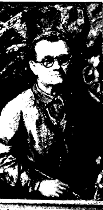
José Aguiar, exposición organizada por el Gobierno Autónomo de Canarias