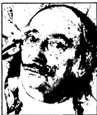
En el año 1925 celebró su primera exposición individual

1983: exposiciones antológicas en Madrid, Barcelona, y Figueras (Gerona).