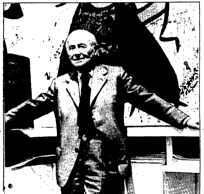
Joan Miró, interés por su obra en Asturias

La exposición de Miró, montada por la Caja de Ahorros de Asturias en colaboración con la Fundación Miró de Barcelona, constituyó el hecho cultural más destacado de la feria y fue, en cierto modo, una continuación del número monográfico que la revista "Los Cuadernos del Norte" dedicó recientemente al pintor.