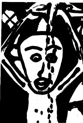
Obra de Cámara

La primera exposición individual la celebra Antonio Cá-