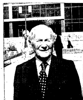
Miró visitó a Matisse