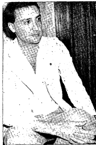
Camacho: "¡No me lo creo!"

● La "Agrupación de Acuarelistas Canarias" una vez más merece nuestra atención. Parece ser que, poco a poco, va venciendo su apatía. Al menos, se reunieron los miembros que componen la comisión provisional y solicitaron la sala del Círculo para exponer en ella el próximo mes de mayo. Como que ya es muy tarde cuando se han acordado de hacerlo, es posible que no se pueda celebrar en este recinto la que, salvo la ausencia del pasado mes de mayo, era ya tradicional muestra acquarelística cada año. No obstante, sabemos que también se ha pensado contactar con otras salas isleñas, por si acaso. ¡Animo, señores!