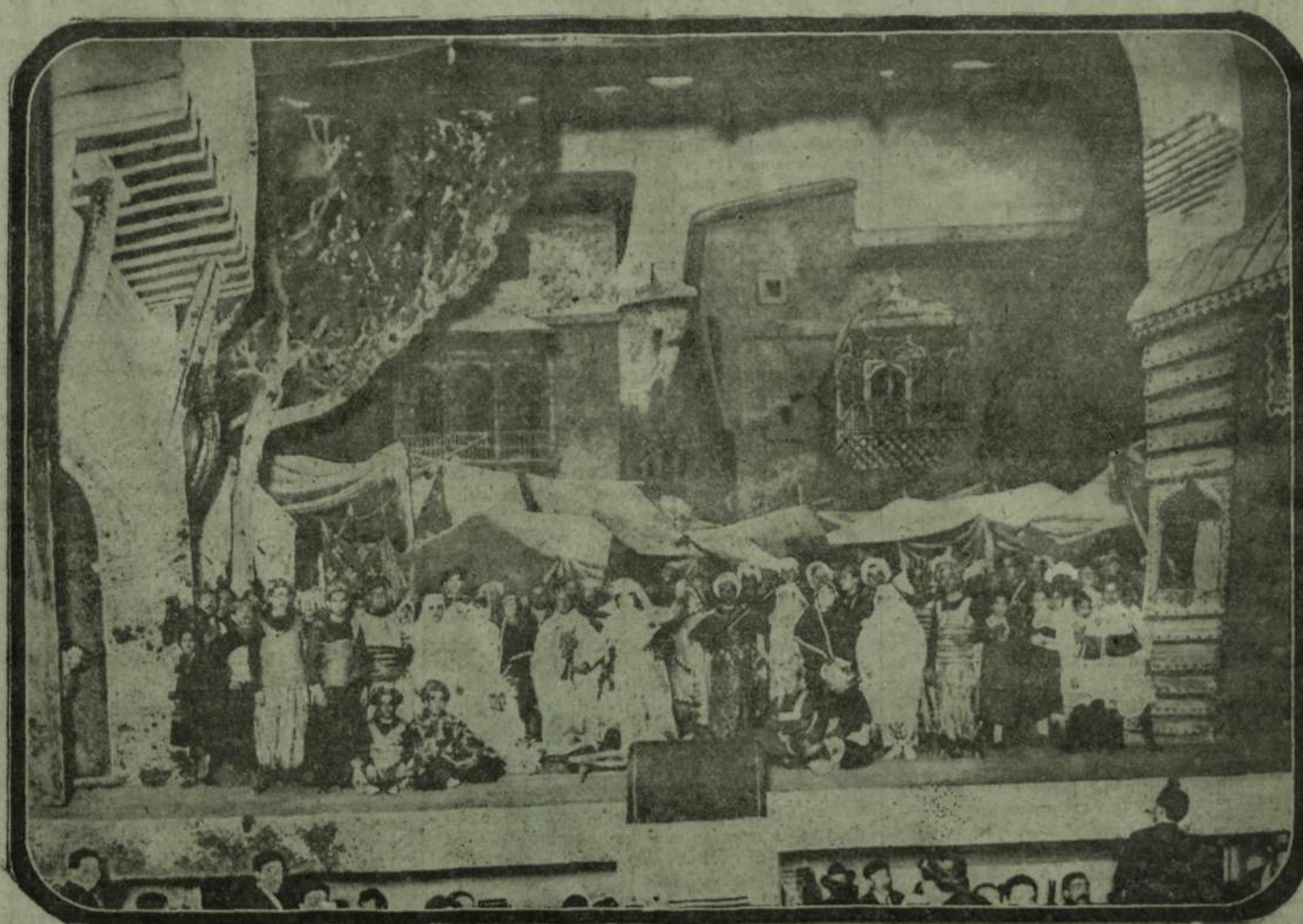
Escena del primer acto de la ópera «La Llama», de Martínez Sierra y Usandizaga, estrenada anoche en San Sebastián con éxito clamoroso.