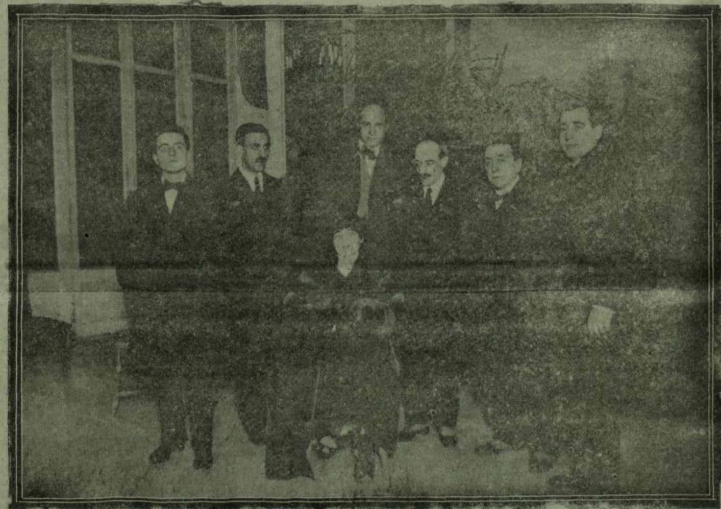
Don Gregorio Martínez Sierra, autor del libro de «La Llama», con los artistas que han interpretado la ópera póstuma de Usandizaga.