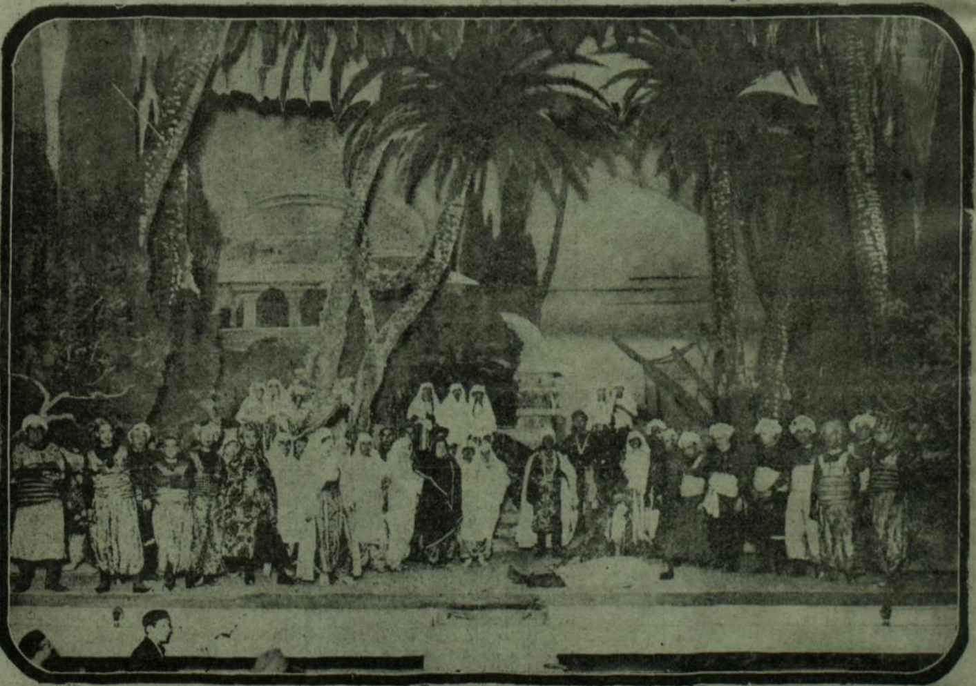
Escena final de la magnífica ópera del malogrado compositor.