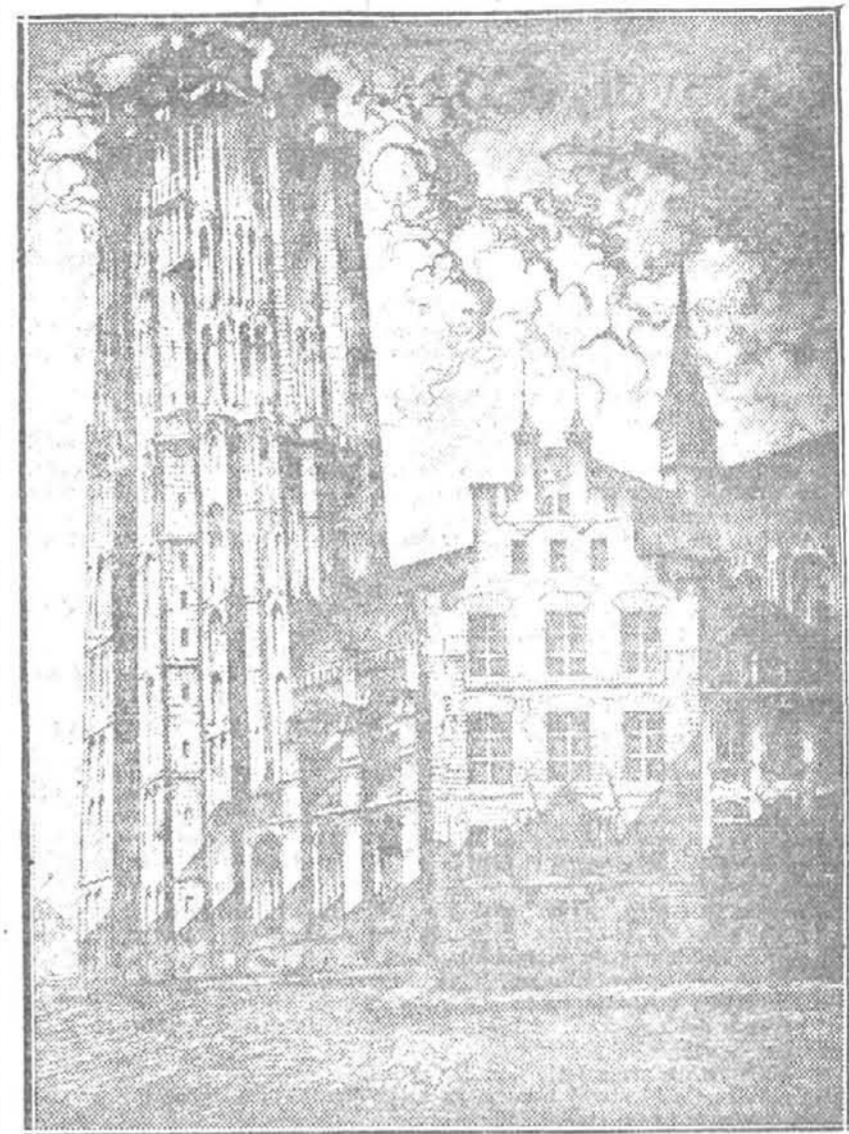
Catedral de Malinas.—Aguafuerte de Manuel Castro Gil.—Primera medalla de grabado en la Exposición Nacional

Hay marinas que causan, por lo que veo, grata impresión exacta de veraneo; el cielo bebe agua de esas marinas, por eso llueve.