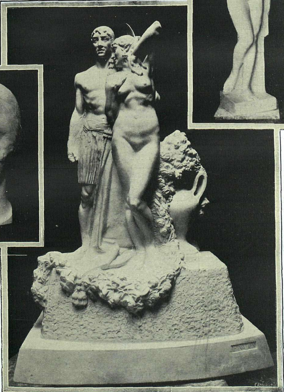
"Valencia", de Ignacio Pinazo