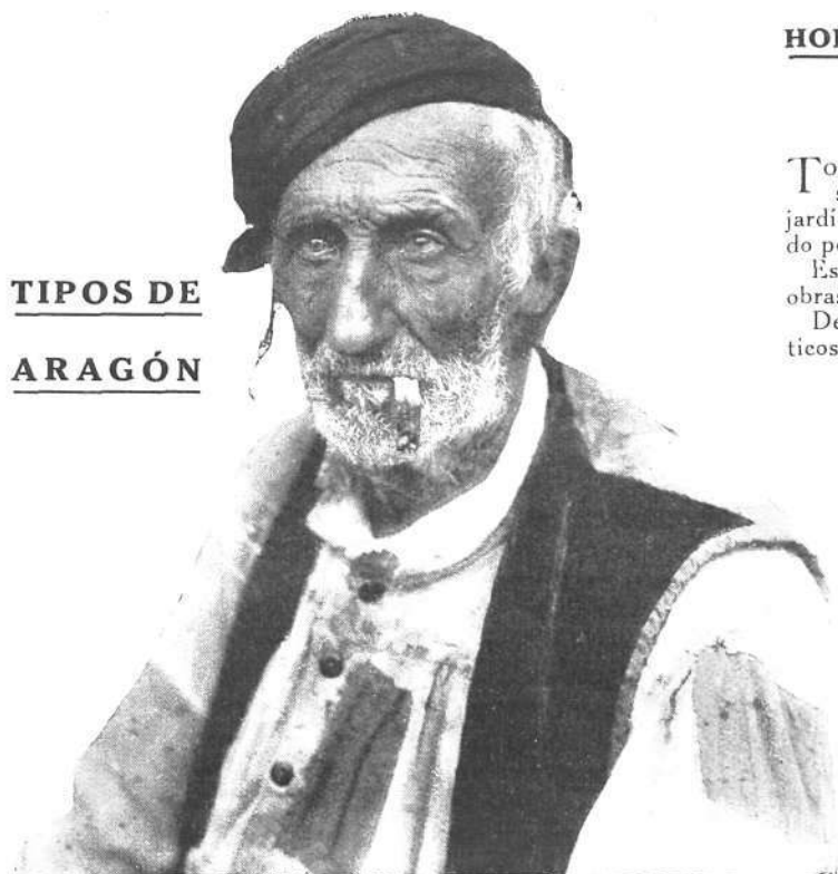
EL BATURRO VIEJO.