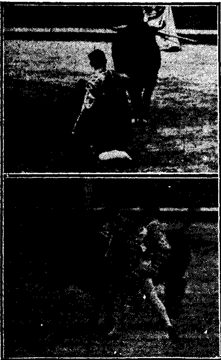
LA CORRIDA DE AYER EN MADRID.—Marcial Lalanda iniciando una faena de muleta.—Un pase de Chicuelo