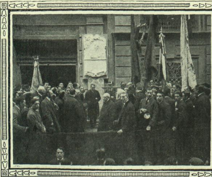
VALENCIA : Homenaje de los alumnos de la Facultad de Medicina al célebre bacteriólogo doctor Ferrán

tuida para amparar el juego y vivir próspera al socaire de su prodigalidad, sino con nobles fines de arte, va a leer un trabajo en que se habla de « Las gentes que han perdido su retrato ». Acudís, un poco distraídos, y pronto el pensamiento generoso y el habla limpia del que lee os conquistan, así como su amplio ademán y el claro tono con que destaca, en la lectura, la esencialidad de sus conceptos. ¿ Quiénes son « las gentes que han perdido su retrato »? Los que no han sabido tejer con los hilos de su vida el acusado perfil de una personalidad propia. Aquellos que la confían a perifollos y condecoraciones, al vano exterior uniformado ; aquellos que, flor de la multiforme y vertiginosa vida moderna, sólo se preocupan por proyectar ante los otros su perfil fugaz de un momento, son « gentes que han perdido su retrato ». Los que ahondaron en su profundo ser, trasluciéndolo en una postura o en una sonrisa para la eternidad, son los únicos dignos de lograrlo ; ellos hacen grandes a los pintores que aciertan con su cabal expresión. 🐾 🐾