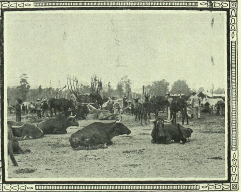
SEVILLA : El mercado de ganados

conferencia sobre el tema « Las gentes que han perdido su retrato ». Asistió al acto un público tan numeroso como distinguido. A propósito de dicha conferencia, el escritor E. Díez-Canedo ha publicado un admirable artículo del que entresacamos unas líneas :