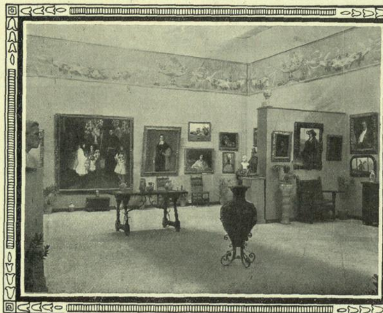
Aspecto de una de las notabilísimas salas de la Exposición