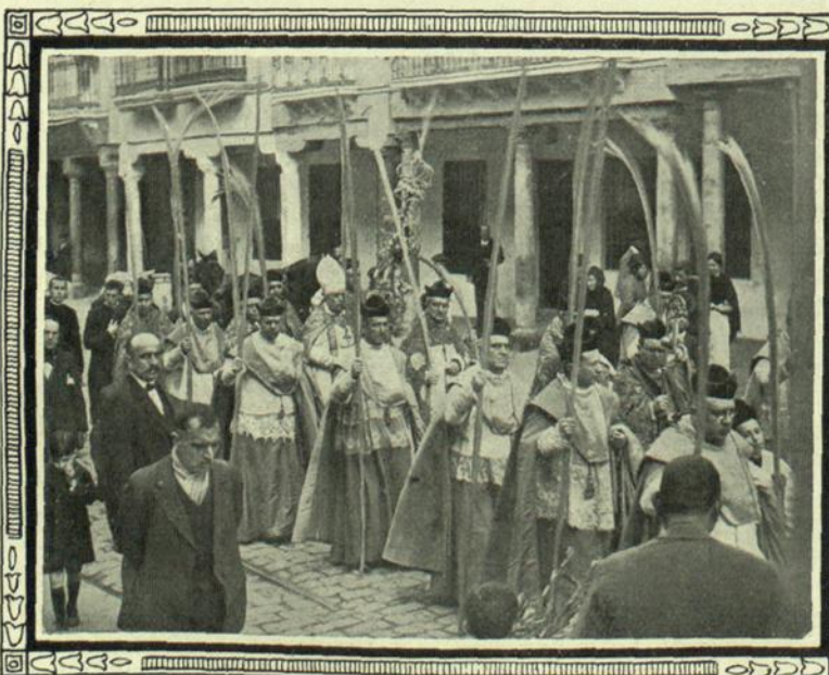
SEVILLA : Solemne procesión de las palmas, celebrada el día de Ramos con asistencia de las autoridades y alto clero

El célebre dramaturgo y poeta don Eduardo Marquina, pronunció en la « Asociación de Pintores y Escultores » una